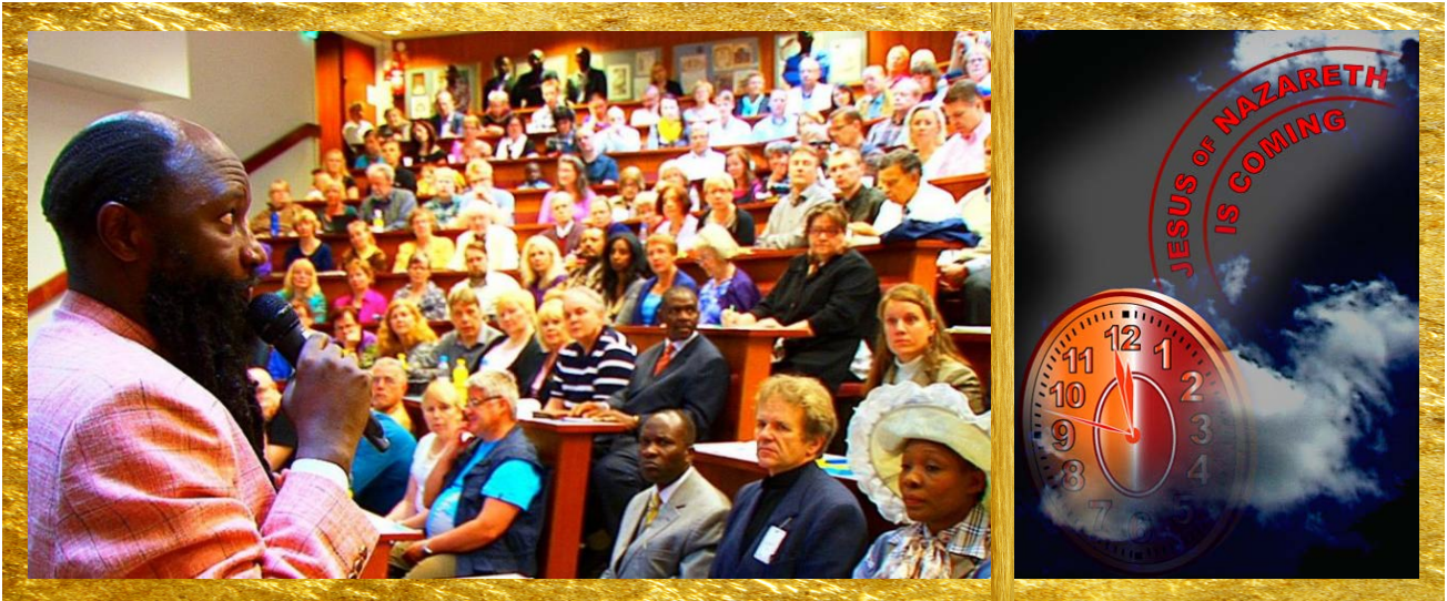
Väkevä Pastorikonferenssi Helsingissä 2013 / Kultainen Kello Taivaassa

Kerroin eilen näystä, jossa HERRA avasi Taivaan ja laski alas Kultaisen Kellon. Kun katsoin Kellon aikaa, niin jouduin paniikkiin. Tiedätkö, miksi HERRA puhuu palvelijansa kanssa unien kautta? Koska unessa Hän on vanginnut kaiken huomiosi täysin yksin Häneen ilman ennako-oletuksia, oikeuskäsittelyitä tai henkilökohtaisia mielipiteitä. Hän on vanginnut sinut täysin ja olet unessa, joten olet täysin Hänen kontrollinsa alla. Kun katsoin tuota Kelloa, menin paniikkiin. Tämä tarkoittaa, että HERRA aiheutti minussa tuon paniikin. Hän halusi minun panikoivan. Tästä syystä, kun tuon sinulle tämän sanoman teille seurakunta, niin teidänkin tulisi mennä paniikkiin. Ymmärsitkö? Jos Hän laittaa minut paniikkiin, Hän tietää, että tulen ja kerron sinulle, että jouduin paniikkiin. Hän odottaa myös sinun menevän paniikkiin! Miksi minä panikoin? Koska näin ajan olevan minuuttia vaille keskiyön! Tässä näyssä, Hän laittoi minut tietämään, että kun keskiyö lyö, MESSIAS tulisi. Tämän vuoksi panikoin. Raamattu sanoo, että kukaan ei tiedä päivää eikä hetkeä. Miksi JUMALA sitten näyttää minulle näyssä Kellon Taivaassa, joka on minuuttia vaille keskiyön?