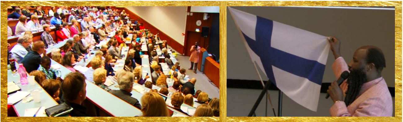
HERRAN Profeetan Suomen vierailu 2013 / Haaga, Helsinki

Lisäksi jaoin sen toisen osan keskustelua liittyen väkevään voimalliseen Valkoiseen Hevoseen. Jakamalla tämän keskustelun sanoman JUMALAN Karitsan häitä, näimme sen vastuun, jonka HERRA antaa seurakunnalle. Näimme, että HERRA sanoo, että kukaan ei tiedä päivää eikä hetkeä. Liittyen tähän keskusteluun seurakunnan kanssa, näimme hyvin selvästi, että itseasiassa Taivas on jo valmistautunut vastaanottamaan seurakunnan. Tämän sanoman me ymmärrämme. Tiedän, että täällä Suomessa, pidätte häitä seurakunnassa. Aina kun häät ovat tulossa, täytyy olla myös hääsormukset. Kun hääsormukset ovat valmiit, se tarkoittaa, että valmistelut häitä varten ovat tulleet päätökseen. Ymmärrämme sen, mitä HERRA sanoo, että valmistelut Taivaassa ovat tulleet päätökseen. Tämä on suuri siunaus, koska Hän tulee kuin varas.